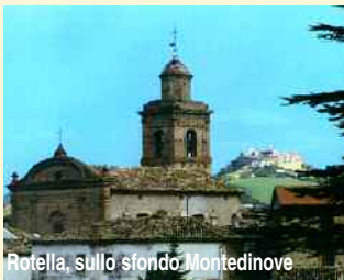
Rotella, sullo sfondo Montedinove