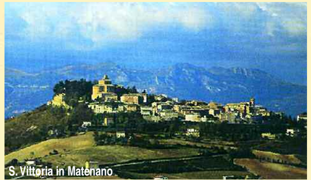
S. Vittoria in Matenano