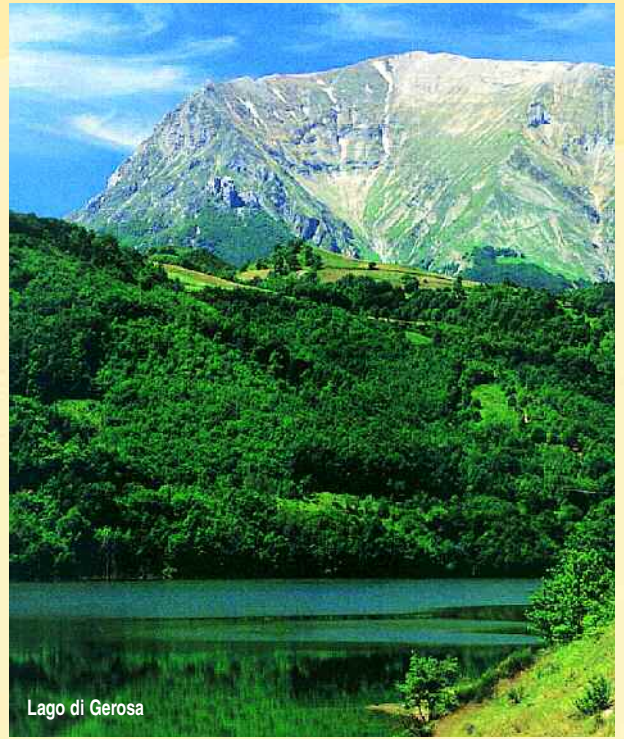
Lago di Gerosa