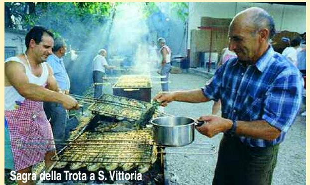
Sagra della Trota a S. Vittoria