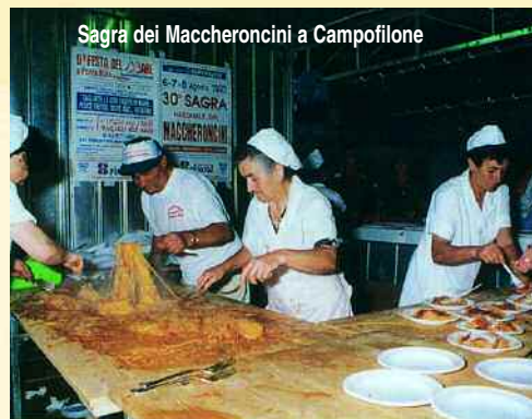
Sagra dei Maccheroncini a Campofilone