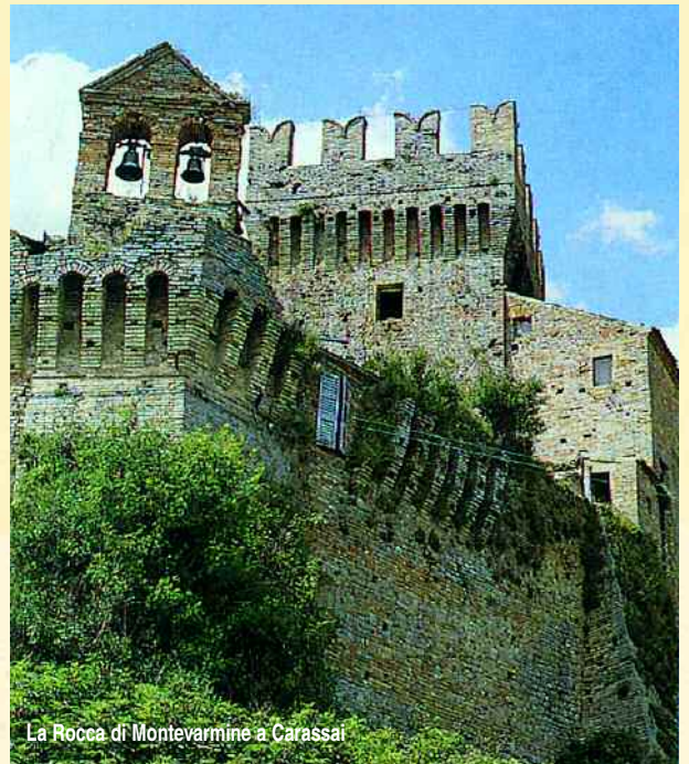
La Rocca di Montevarmine a Carassai